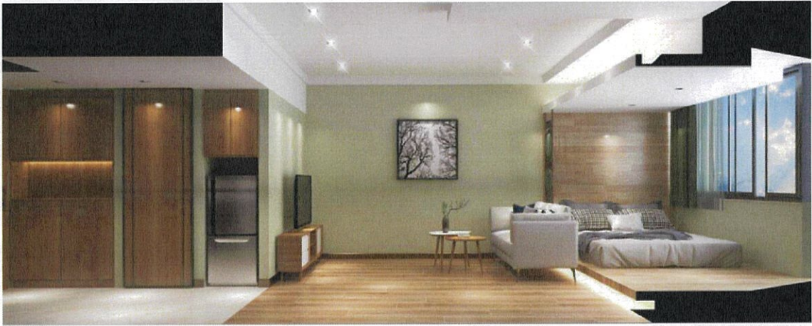
( 丝绸酒店八楼客房升级改造 )

( 三 ) “数字资管系统” 在集团系统应用推广，粤新资产着力打造专业化资产经营管理平台参与市场竞争核心能力，实现信息化、互联网化、数字化赋能一体化。